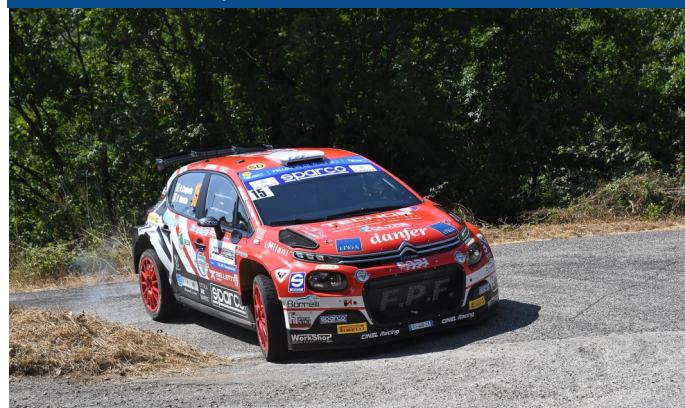
SCUDERIE: E.A. Sport Investment