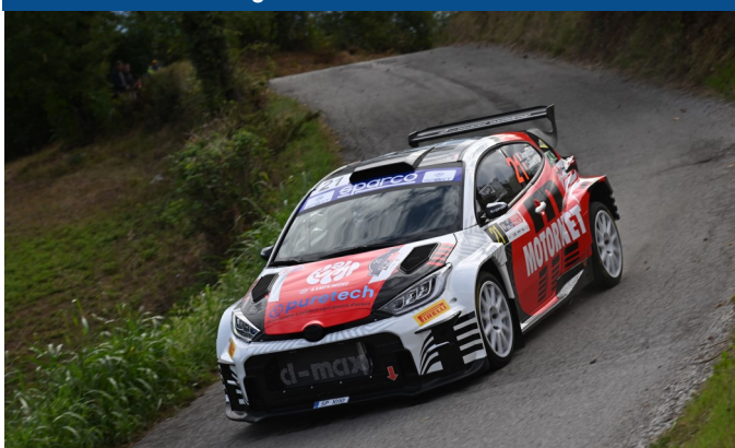
OVER 55: Fabio Angelucci